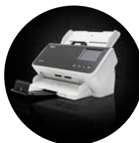
Scanners Alaris S2060w/ S2080w