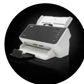
Scanners Alaris S2040/S2050/S2070